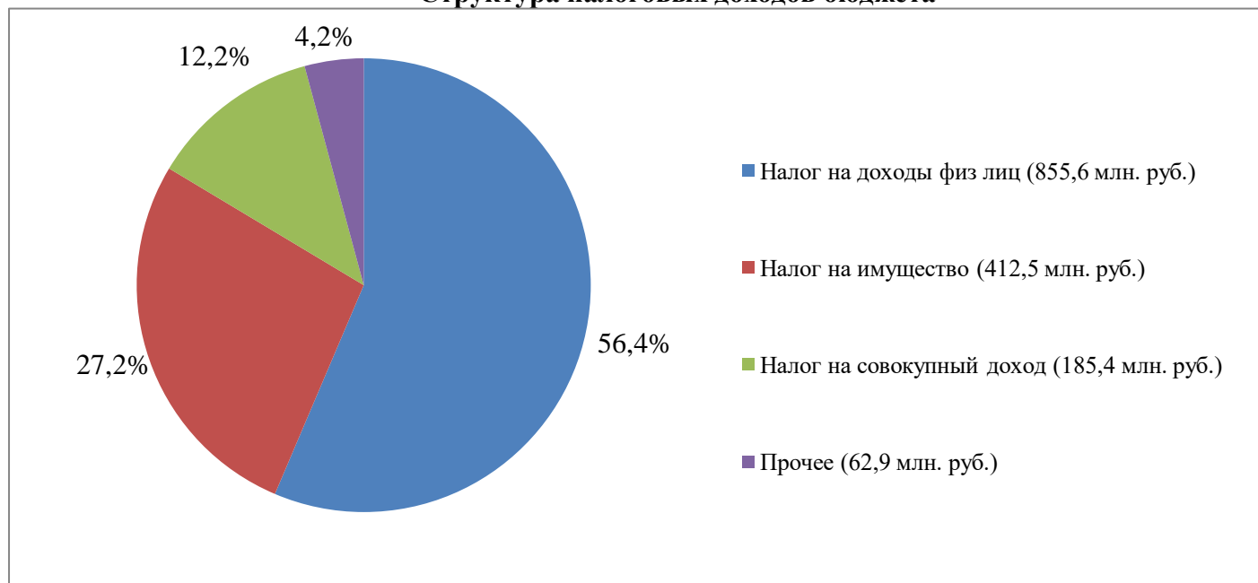
Структура налоговых доходов бюджета

Неналоговые доходы поступили в сумме 265,4 млн. рублей, что выше планируемого на 61,0 млн. рублей.