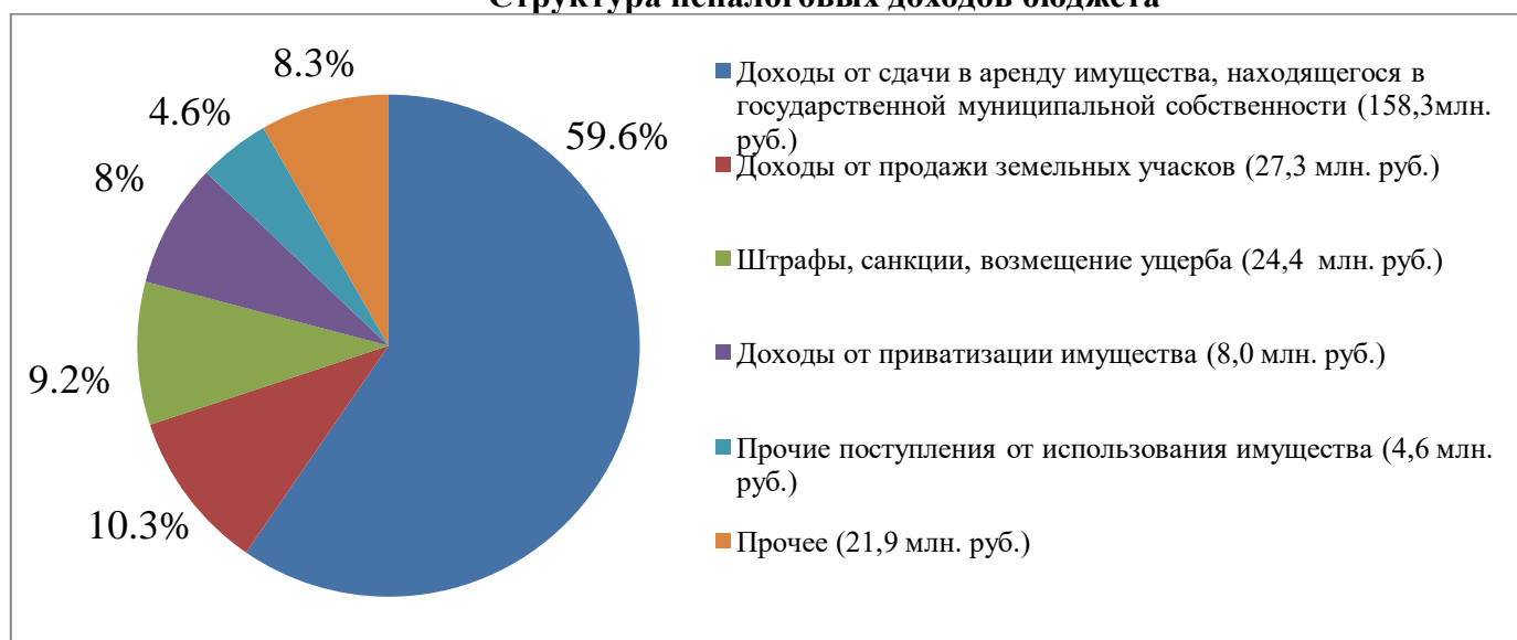
Структура неналоговых доходов бюджета

Неналоговые доходы поступили в сумме 265,4 млн. рублей, что выше планируемого на 61,0 млн. рублей.